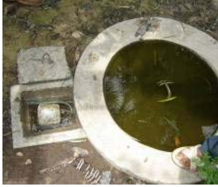
ບໍ່ໝັກແກດສຊີວະພາບ