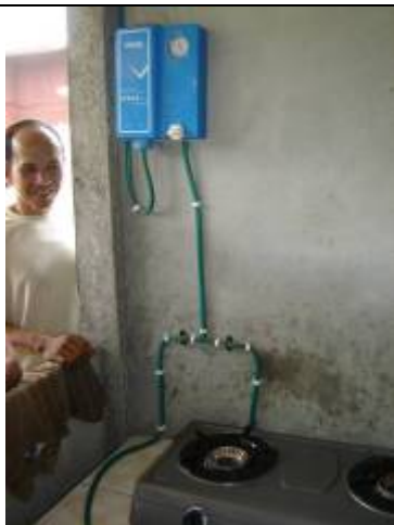
ເຕົາແກດສຸຊີວະມວນກັບທີ່ສົ່ງແກດສ໌ ແລະເຄື່ອງແທກຄວາມດັນ