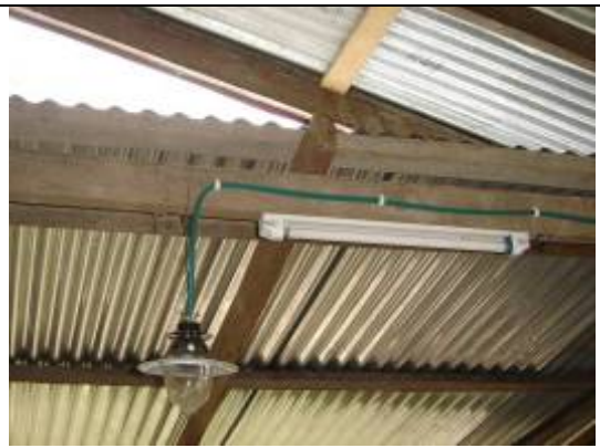
ດອກໄຟ ແກດສ໌